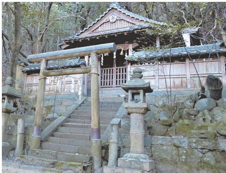
磐座信仰を伝える船山神社の拜殿と陽石（右中段）