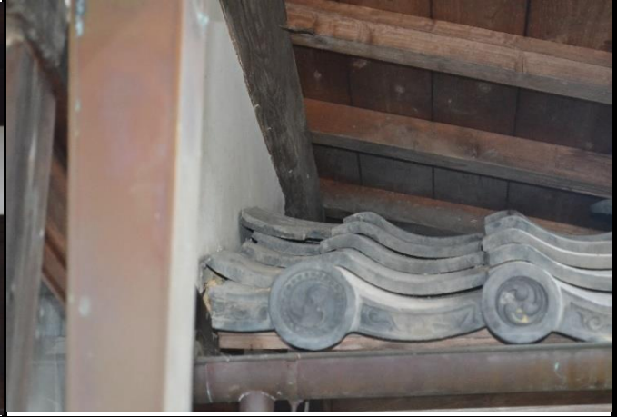
庫裡の壁と下屋の瓦との隙間