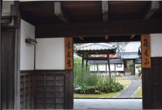
山門より本堂を望む