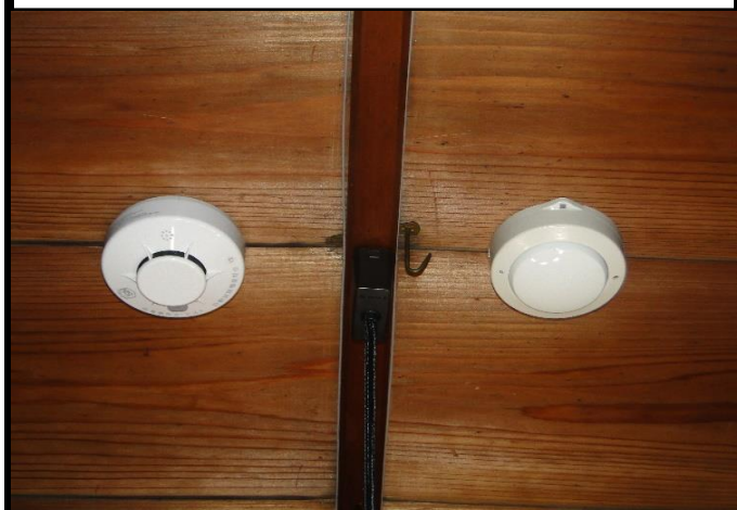
本堂などの火災感知機(右)と火災・防犯センサー