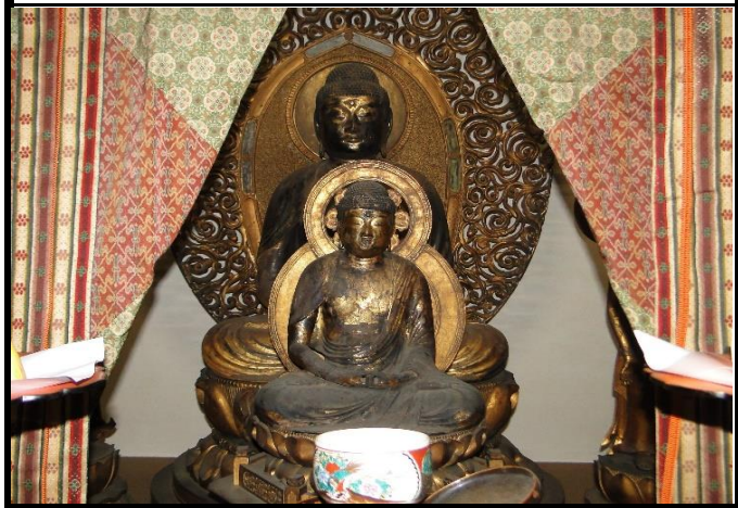
本尊などを安置する鉄筋の本堂