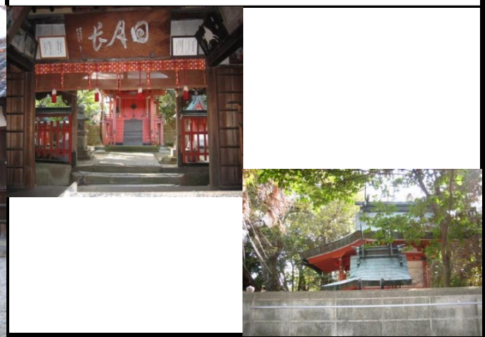
奥に本殿(県指定)が祭られている