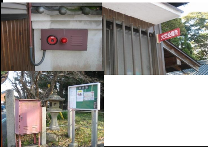
防火対策は行われていると思われる