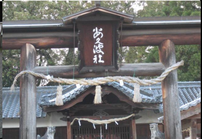
神社の印字は富本憲吉によるもの