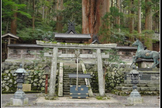
鳥居の奥、階段上方が本殿