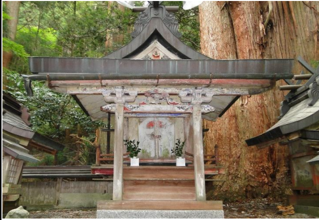
県指定の木造男神像を安置する本殿