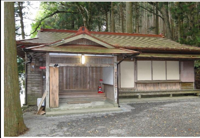
白アリ被害があった社務所