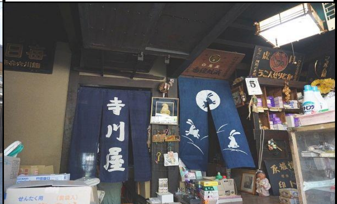
「寺川屋」の屋号で和蠟燭の製造販売をしてきた