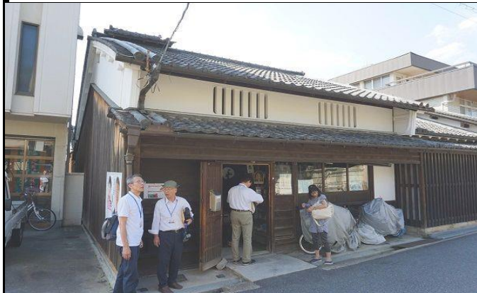
道路に面した正面(南側から)