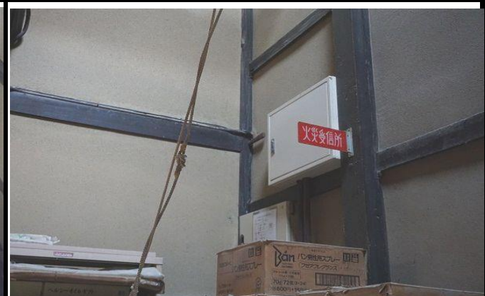
土間の壁に設置している火災受信機