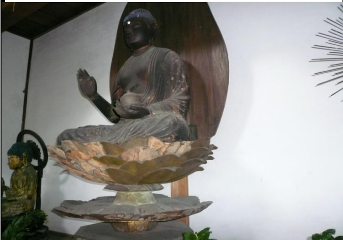
県指定文化財の木造薬師如来坐像