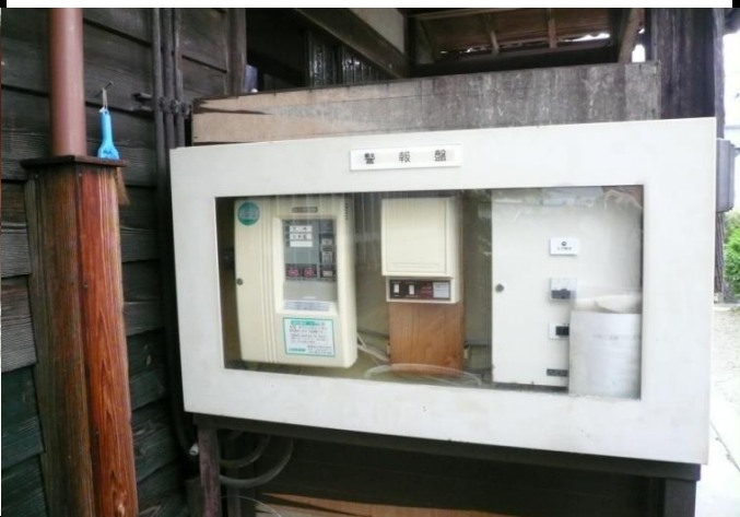
入口左側面の警報盤