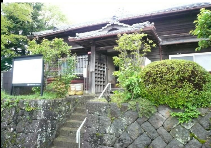
西峠会館(阿弥陀堂)の外観