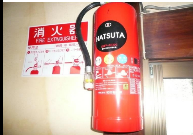
入口の内部の壁に設置の消火器