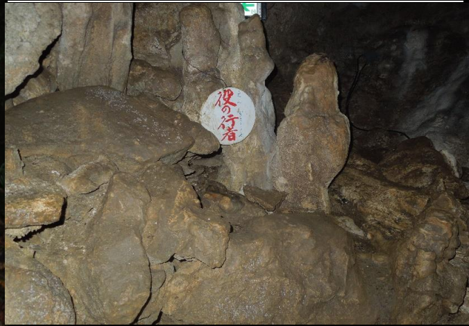
足に当たりそうな石筍