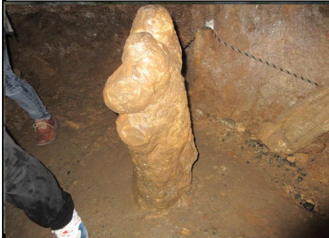
通り道ぎりぎりにある石柱