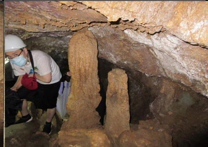
広い洞内。左は「白鶴の姿」、右は「千成瓢箪」