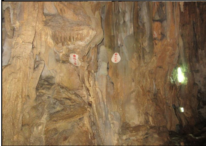
形状が美しい「藤の棚」