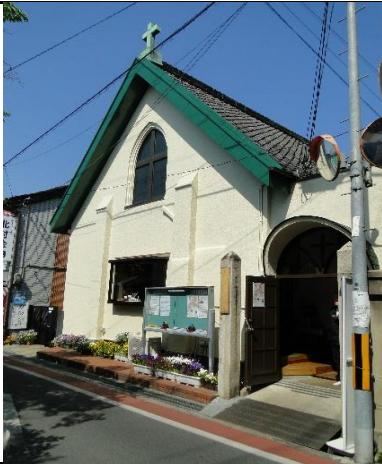
県指定の高田基督教会堂の西側正面