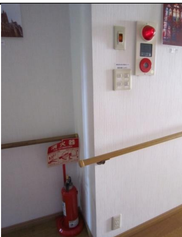
礼拝室横の廊下の火災報知機(右上)と消火器