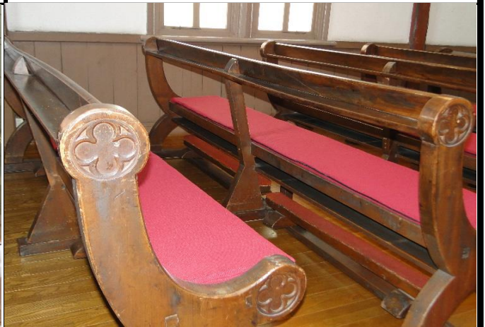
教会堂の建物と共に長椅子なども一括で県指定に