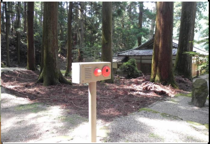
本殿屋根の一部修理跡