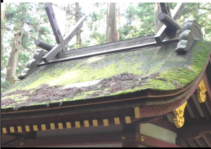
【調査票記入者(中西環)の感想】

龍神伝説で知られ、自然崇拝のなごりを感じる境内は魅力的だった。山と水に守られているが、昨今の災害事情を鑑みると、土砂災害なども懸念事項かもしれない。維持継承の難しさを感じた。