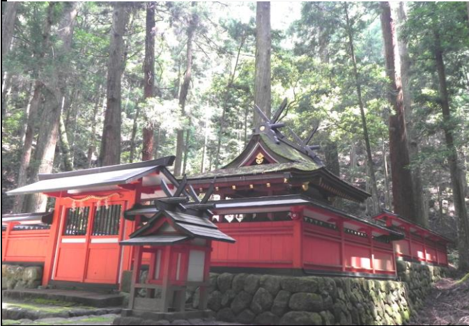
春日若宮神社の旧本殿(慶安5年製)を移設の本殿 本殿背面