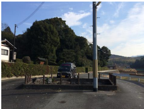
崇道天皇陵前古墳

崇道天皇八嶋陵(現・奈良市八 島町)の前に道路を分断するよう に不自然な囲いがある。中を覗き 込んでみると大きな石が数個置か れ石仏も祀られている。